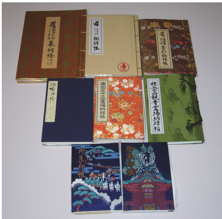
写真1 今までに集まった御朱印帳

その中で、ある年の初詣時に出掛けた神社にて朱印帳を購入したのを転機として、積極的に寺社に出掛けるようになりました。今までに集まった朱印帳を写真1に示します。寺社へ参拝した際には、御朱印を頂いてきますのでいつの間にか朱印帳自体も増えてきています。