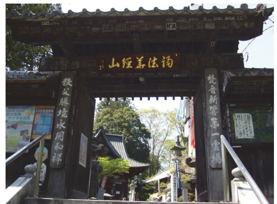
写真3 秩父霊場の札所寺院