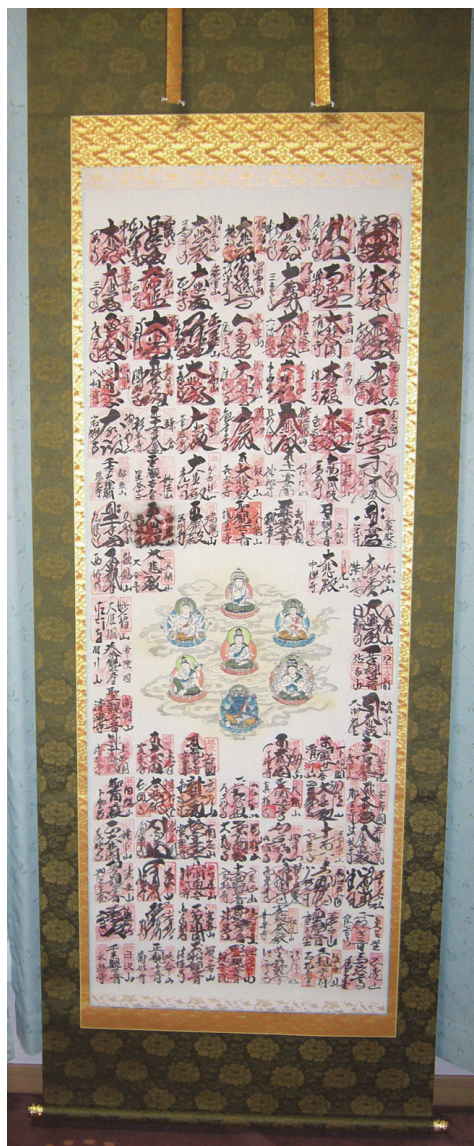
写真4 百観音巡礼での納経軸

巡礼のときは朱印帳に御朱印をいただくのではなく、納経軸を作ってみました。5年くらいかかりましたが、無事に巡礼することができました。写真だと少し見えにくいのですが、写真4に完成した納経軸を示します。